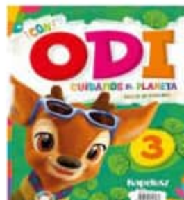
Imagen del libro:

Asistir con pelo corto o recogido. No podrán utilizar aros colgantes, expansores, uñas pintadas. Los accesorios del cabello serán azules o blancos.